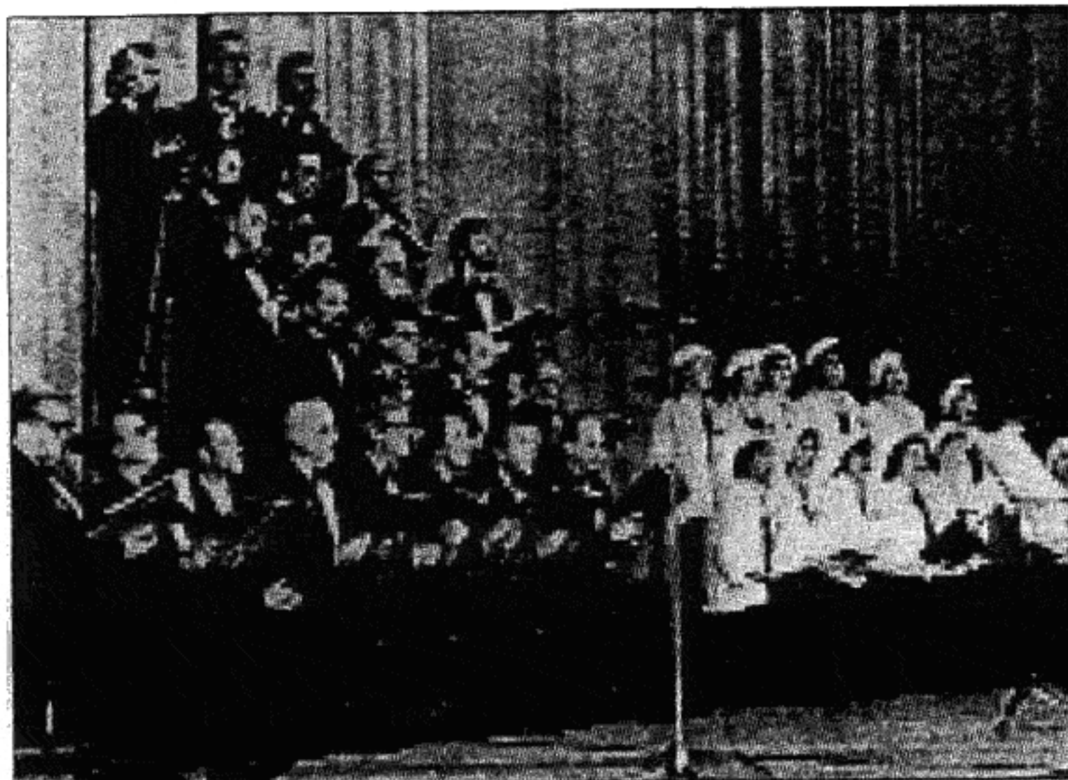
Исполняется "Таратория". 1988 г.

Может быть, наоборот. Ах, канава, ты канава, Я вчера туда упал, Не пора ли докопаться, Кой же черт тебя коцал. Тут канава, там канава, Можно голову сломать, Не пора ли Моссовету Эту песенку кончать.